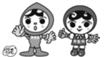
人権イメージキャラクター 人KENまもる君 人KENあゆみちゃん